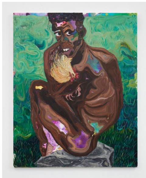
Ludovic Nkoth, "Don't take this too", 2020, acrylique et sable sur toile. © Courtesy Ludovic Nkoth.