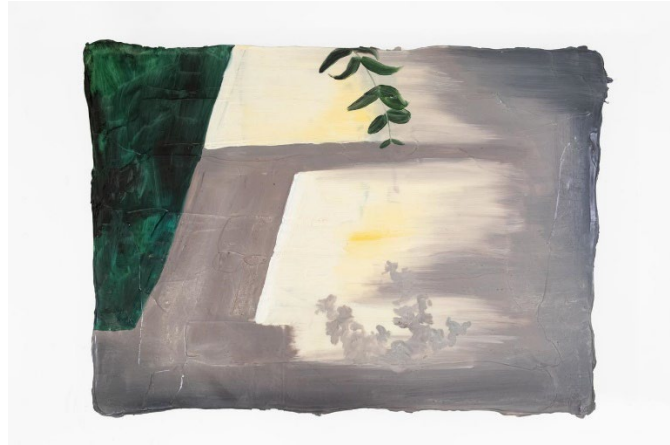
"Heureusement Pawel", 2022, peinture à l'huile sur medium May, peinture à l'huile sur medium acrylique.