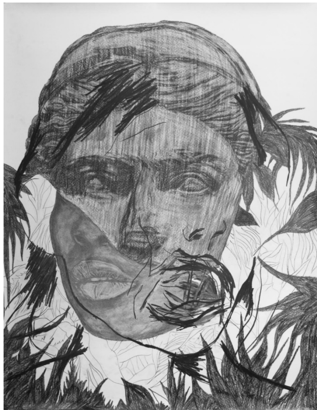
Frédéric Malette, "Attrapez votre amme de vos yeux brûlants", 2021, graphite sur papier.